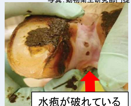
水疱が破れている

毎日必ず健康観察 し、これらの症状を見つけ次第、直ちに 獣医師 や最寄りの 家畜保健衛生所に連絡 しましょう。