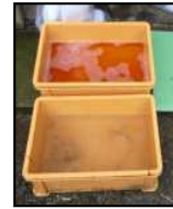
推奨される踏込消毒槽の設置方法