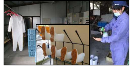
専用の服や靴の使用、手指消毒