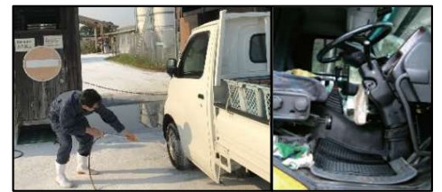
車両はタイヤだけでなく、 泥よけの内側まで消毒 し、 フロアマットの交換やペダル等車内も消毒