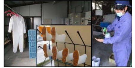
専用の服や靴の使用、手指消毒