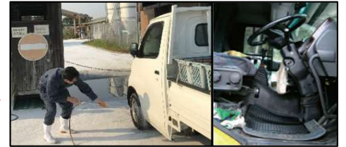
車両はタイヤだけでなく、 泥よけの内側まで消毒 し、 フロアマットの交換 や ペダル等車内も消毒