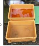
推奨される踏込消毒槽の設置方法！